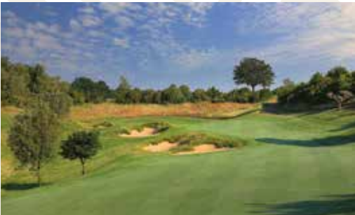
Antognolla Golf, Umbrien, Italien

Als Mitglied des Berlin Capital Club haben Sie die Möglichkeit, fast 250 exklusive Stadt-, Sport-, Country- und Golfclubs gegen Vorlage Ihrer persönlichen IAC-Karte oder IAC-App weltweit zu nutzen. So bieten Ihnen die renommierten Clubs in vielen internationalen Metropolen ein „Home away from Home“.