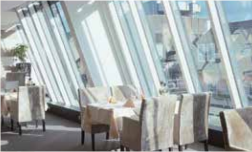
Wirtschaftsclub Düsseldorf , Düsseldorf, Deutschland